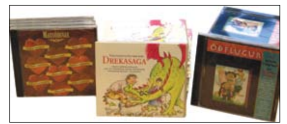
Diskarnir þrír, Mansöngvar, Óðflugur og Drekasaga, sem Umhyggja hefur gefið út.

Drekasaga, þriðji diskurinn, sem Umhyggja hefur gefið út, er kominn á markað. Verkið er byggt á samnefndu ævintýri lðunnar Steinsdóttur. Tónlistin er eftir Jóhann Helgason tónlistarmann sem átti hugmyndina að þessum diskum sem og tveimur öðrum sem á undan eru komnir á vegum Umhyggju; þeir eru Mansöngvar og Óðflugur. Lögin á diskunum eru öll eftir Jóhann Helgason.