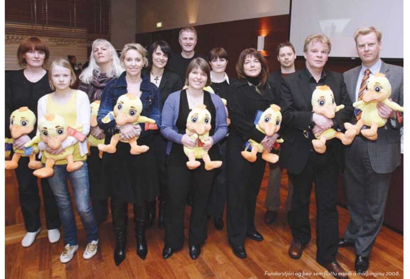
Fundarstjóri og þeir sem fluttu erindi á málþinginu 2008.

„RÁÐGJAFAR SJÓNARHÓLS HLUSTA Á FORELDRA OG LEITA LAUSNA Í SAMVINNU VIÐ ÞÁ. STUNDUM NÆGJA NOKKUR VIÐTÖL Eða SÍMTÖL EN Í SUMUM TILVIKUM ER EFNT TIL SAMEIGINLEGRA FUNDA MEÐ ÖLLUM SEM SINNA SAMA BARNI Á MISMUNANDI STÖÐUM.“