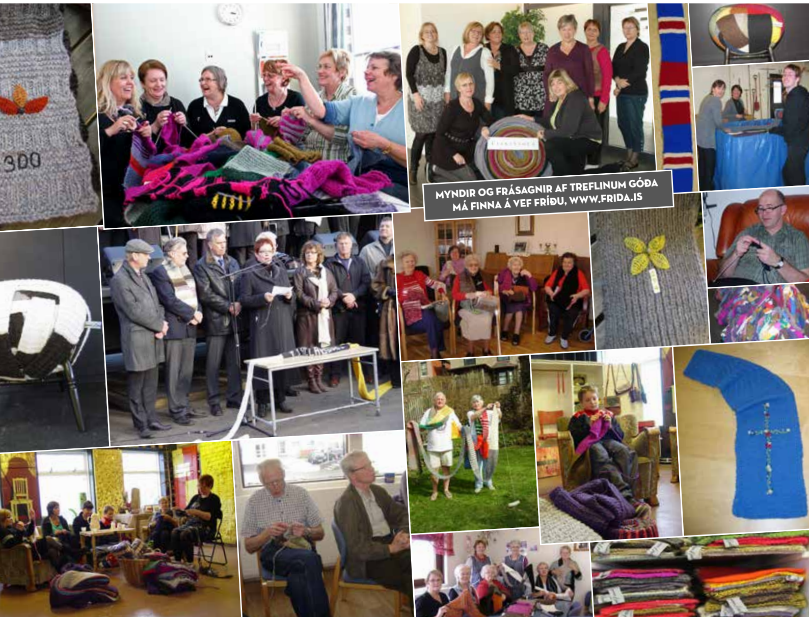
MYNDIR OG FRÁSAGNIR AF TREFLINUM GÓÐA MÁ FINNA Á VEF FRÍÐU, WWW.FRIDA.IS

„HANDPRJÓNASAMBANDIÐ HEFUR SELT TREFLANA OG ÝMSIR AÐRIR. LÁGMARKSVERÐ FYRIR TREFIL ER 2000 KRÓNUR.“