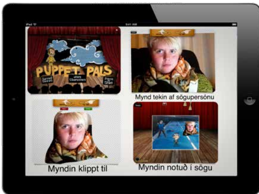
Puppet Pals forritið.