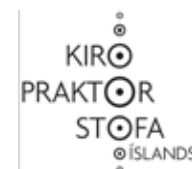
Kíopraktorstofa Íslands Krossalind 13, 200 Kópavogur