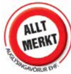
Allt Merkt Hverfisgata 105 Reykjavík