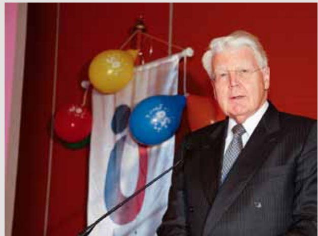
Forseti Íslands ávarpar málþingsgesti.

Félagið og málþingið lýsa áhyggjum af stöðu heilbrigðisþjónustu langveikra barna á næstu árum og velta fyrir sér hver staðan verður árið 2015. Gríðarlegar framfarir hafa átt sér stað á sviði barnalækninga og umönnunar langveikra barna á undanförunum áratugum og mikið áunnist í réttindamálum þessa hóps. Vaxandi áhyggjur eru hins vegar af niðurskurði í heilbrigðisþjónustu, atgervisflotta úr heilbrigðisstéttum og því að langveik börn þurfi að sitja á hakanum. Mikilvægt er að hin frábæra þróun sem orðið hefur á þessu sviði á undanförunum árum stöðvist ekki. Óskað er eftir því að yfirvöld leggi sitt á vogarskálarnar til að tryggja áframhaldandi framþróun á þessu sviði.