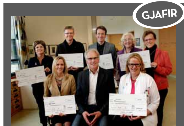
Glæsilegur hópur þeirra sem tóku við styrkjum í framhaldi af Herminator golfmótinu sem haldið var í Vestmannaeyjum.

Eða eins og lítill sjúklíngur sagði eitt sinn þegar vandamálin virtust óyfírstíganleg:–Getum við bara ekki hjálpast öll að? „Ég er sannfærður um að við eigum ekkert val. Við verðum að hjálpast að og allir verða að vera með. Umhyggja hefur í 30 ár þróast úr félagi fagstétta yfir í samstarfsvettvang heilbrigðisstétta, foreldra og aðstandenda langveikra barna, já allra sem láta sig velferð langveikra barna skipta og orðið þar með sá öflugi málsvari langveikra barna sem það er. Á sama hátt þurfum við að vinna saman og þurfum þá ekki að hafa áhyggjur af því hver ætlar að lækna langveika barnið mitt árið 2015 eða eins og litli sjúklíngurinn minn sagði svona til skýringar á því hvers vegna allir ættu að hjálpast að: ÞÁ VERÐUR ALLT Í LAGI.“