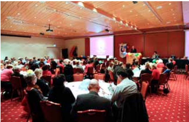
Horft yfir málþingssalinn á Grand Hótelu.